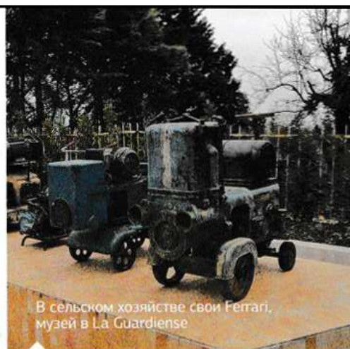
В сельском хозяйстве свои Ferrari, музей в La Guardiense