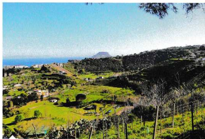
Виноградникам La Sibilla с видом на Неаполитанский залив завидуют туристы