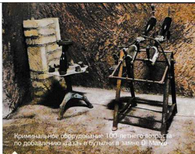
Криминальное оборудование 100-летнего возраста по добавлению «газа» в бутылки в замке Di Marzo