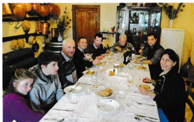
Итальянский семейный обед не обходится без вина (Cantina del Barone)

Хороший стержень наблюдает у вин из фиано, это обманчиво легкомысленные вина, собранные и глубокие. Цветочная тональность преобладает, но у хороших фиано подчеркнута семейная ореховость от выдержки на осадке. Удачные урожаи 2014 и 2015 хорошо демонстрируют достоинства сорта.