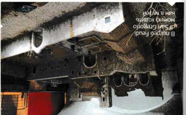
В порте Feudi di San Gregorio можно ходить как в музее

На дегустации вин в кооперативе La Guardiaense (Беневенто), куда входят больше тысячи виноградарей, подзорительным показались равный и достаточный высокий уровень вин, сочная и яркая пропессия. Президент охотно выдал секрет: их консультант — знаменитый тосканский энолог Рикардо Котарелла, каждый месяц он или члены его команды проводят дегустацию в погребках коопы, добываясь правительного звучания. Схожие по стилистике вина были узнаваемы еще у нескольких хозяйств — всего шесть виноделен, принявших участие в антеприме, оказались по-допечными легенды, вызывая в матери старую дискуссию о термине cotarellite. Ничего удивительного,