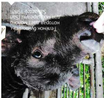
Теленок биволиты которая дает молоко для моцареллы (San Salvatore 1988)

пьедирроссо — на каждый день, альянико — вино воскресное, то винные авторы объявили: если итальянские и морепродукты. Итальянские зрвками, сопроводжая ими и мя- и молудыми, и выдержанными ридирроссо — интересные современ-