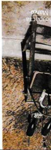
В сельском хозяйстве свои Ferrari, Музей в La Guardiese