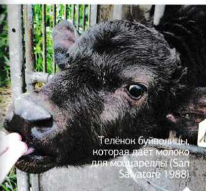
Телёнок буйволлицы, которая даёт молоко для моцареллы (San Salvatore 1988)